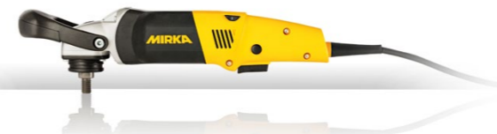
Mirka® PS 1437