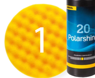
Golden Polish 1: gelbes Polierpad + Polarshine® 20 (1 L, 250 ml)