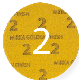
Golden Finish 2: Schaumstoff-Schleifmittel, 150 mm zum Entfernen von Kratzern