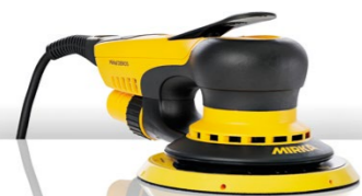
Mirka® DEROS 650CV

Golden Finish System - die schnelle und einfache Lösung nach dem Lackieren: 1-2-GO! wenige Produkte – schneller Prozess – einfach und präzise