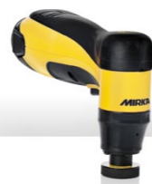
Mirka® AOS-B 130NV