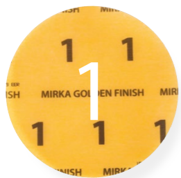
Golden Finish 1: Folienschleifmittel, 150 mm zum Schleifen von großen Flächen