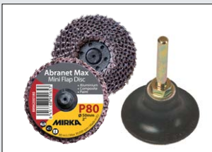
Abranet Max Flap Disc & Adapter Körnung 40-120