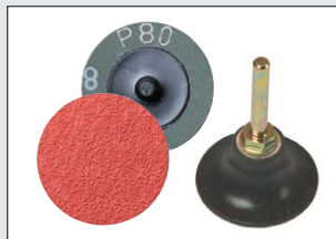
Andere Quick Lock discs 50 mm / Körnung 36-120