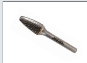
Werkzeuge zum Entgraten, Schneiden und Sonstiges, die auf die 6 mm Werkzeugaufnahme passen