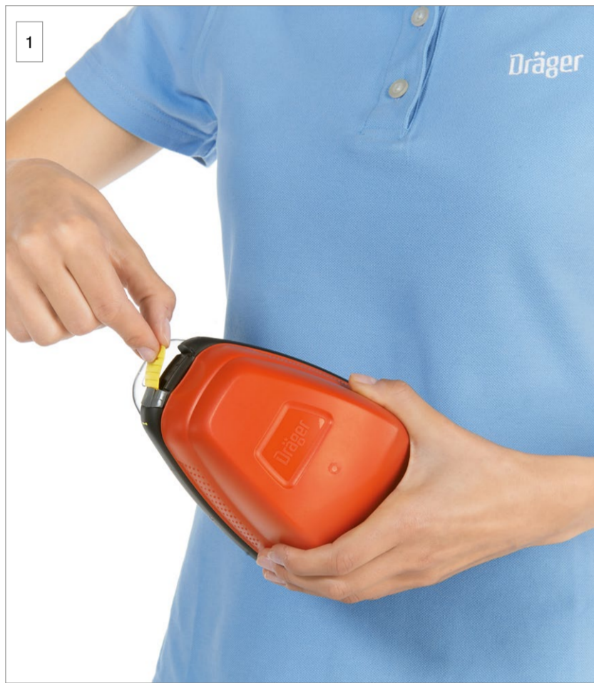
1 Reißen Sie die Plombe mithilfe der Lasche auf.