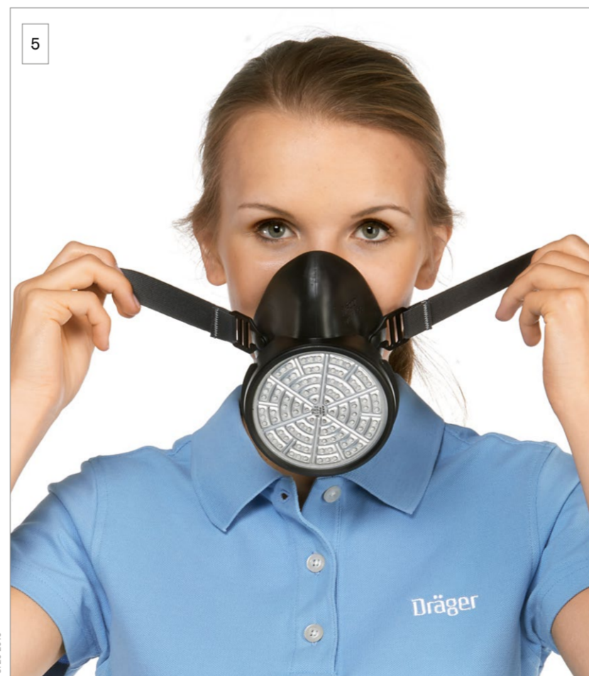
5 Fassen Sie die Halbmaske an den Bändern, halten Sie sie vor Mund und Nase, so dass Ihr Kinn in der Kinnmulde liegt.