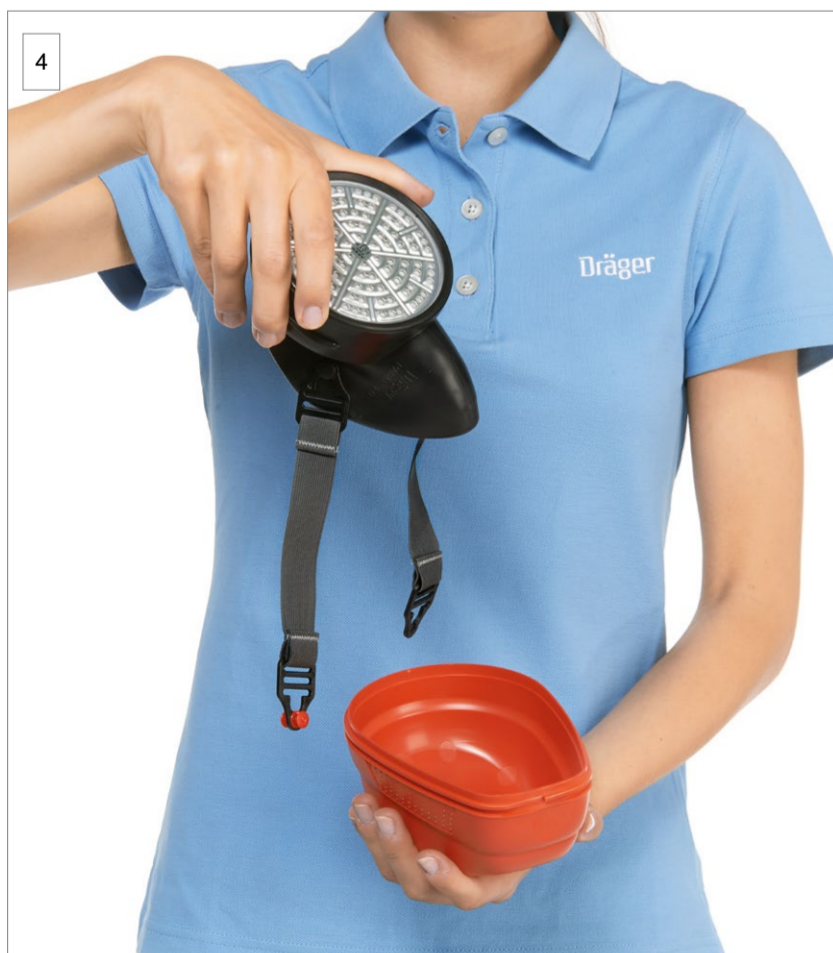
4 Entnehmen Sie das Gerät.