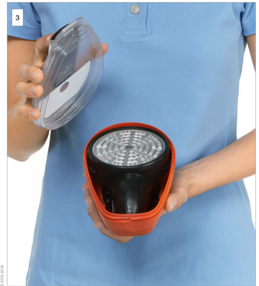
3 Öffnen Sie die Verpackung.