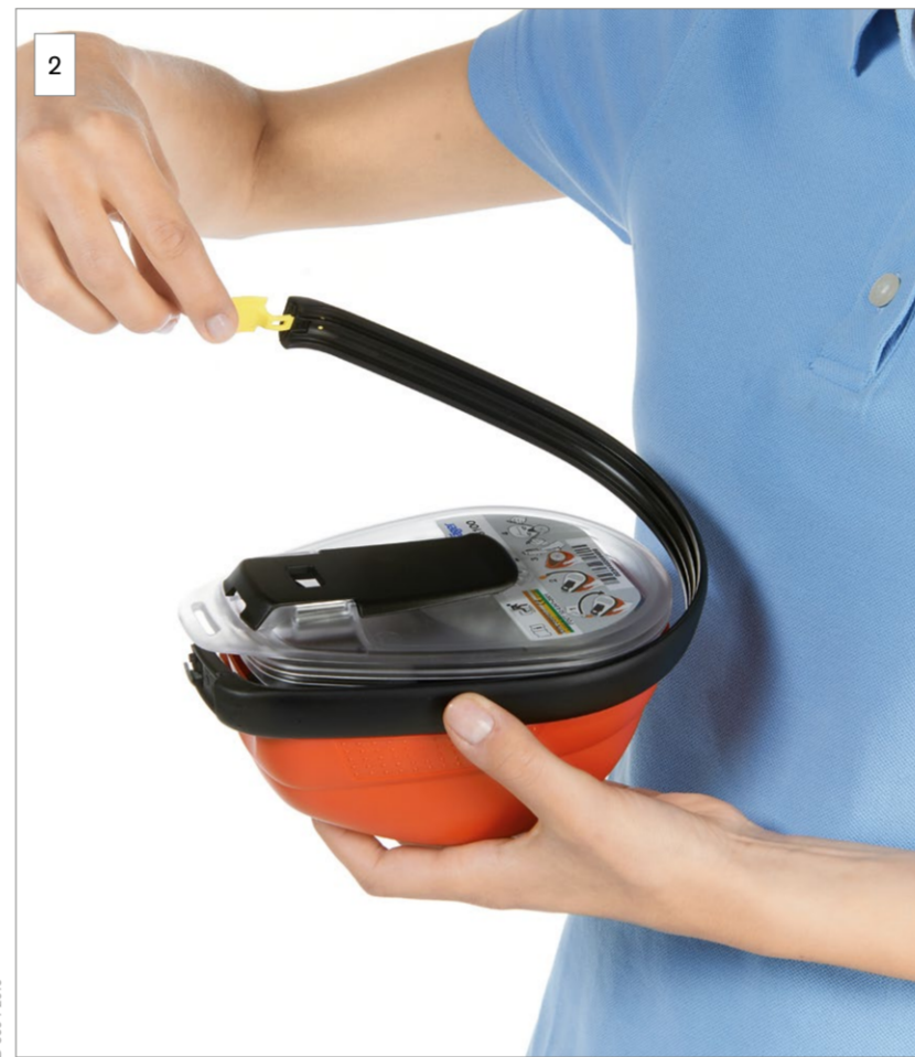
2 Entfernen Sie das Verschlussband.