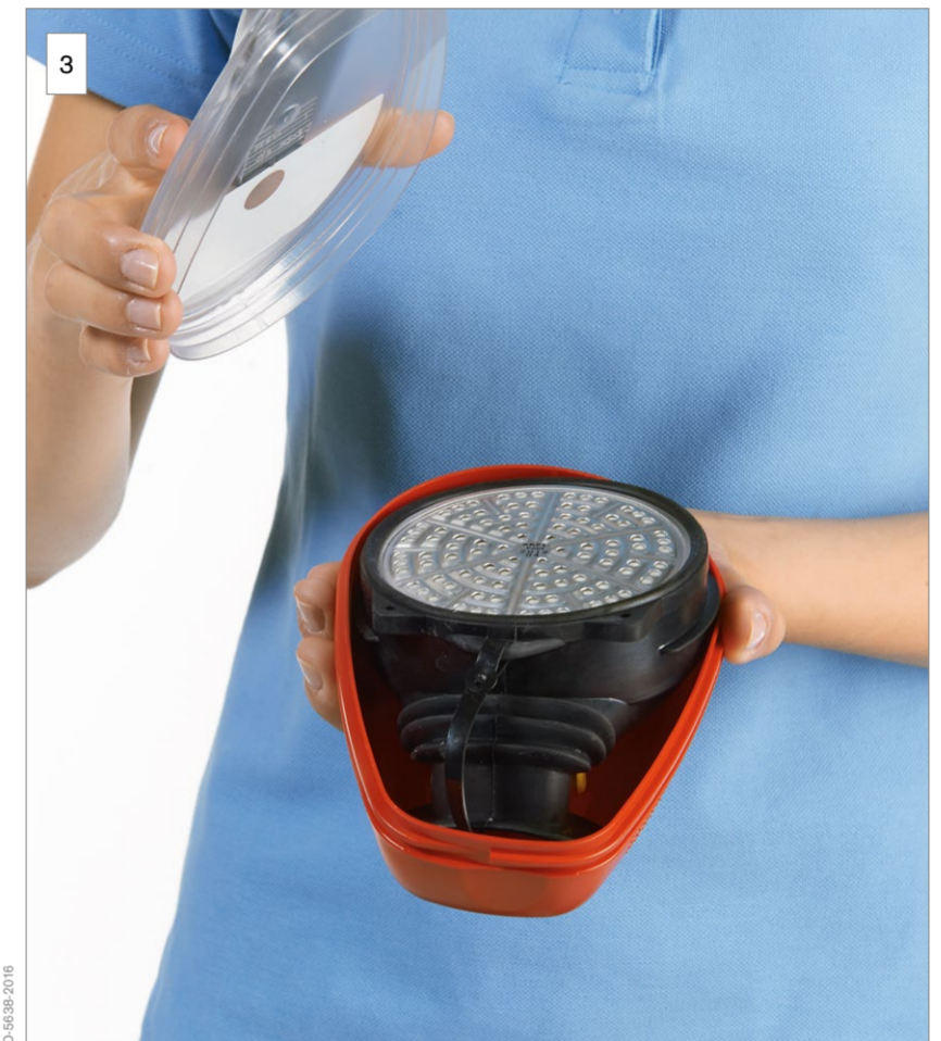
3 Öffnen Sie die Verpackung.