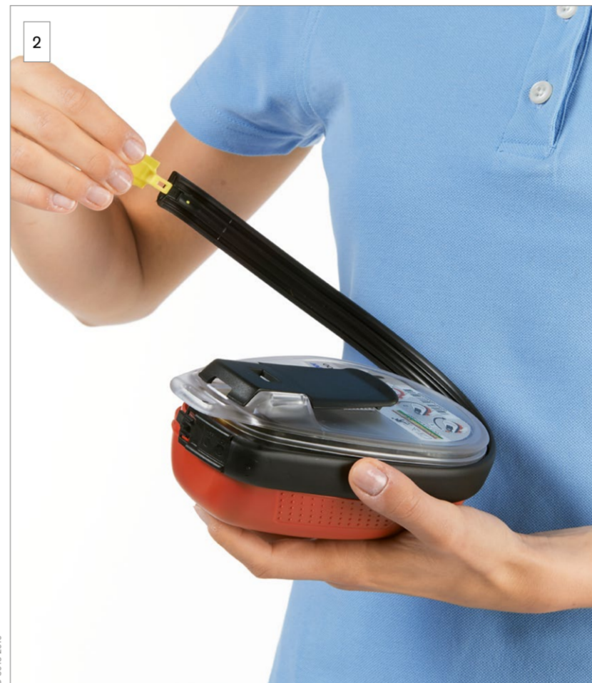
2 Entfernen Sie das Verschlussband.