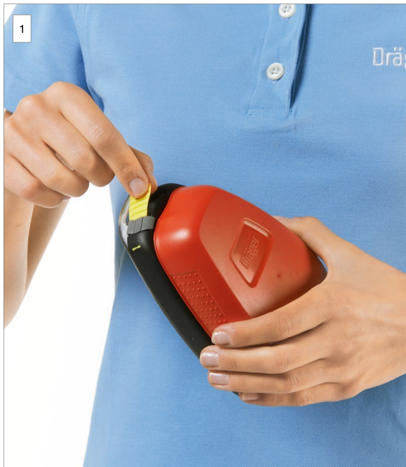
1 Reißen Sie die Plombe mithilfe der Lasche auf.