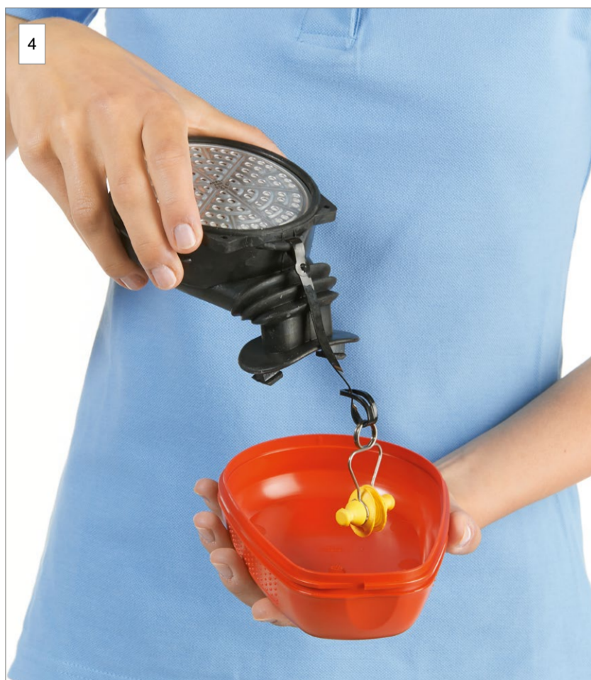
4 Entnehmen Sie das Gerät.