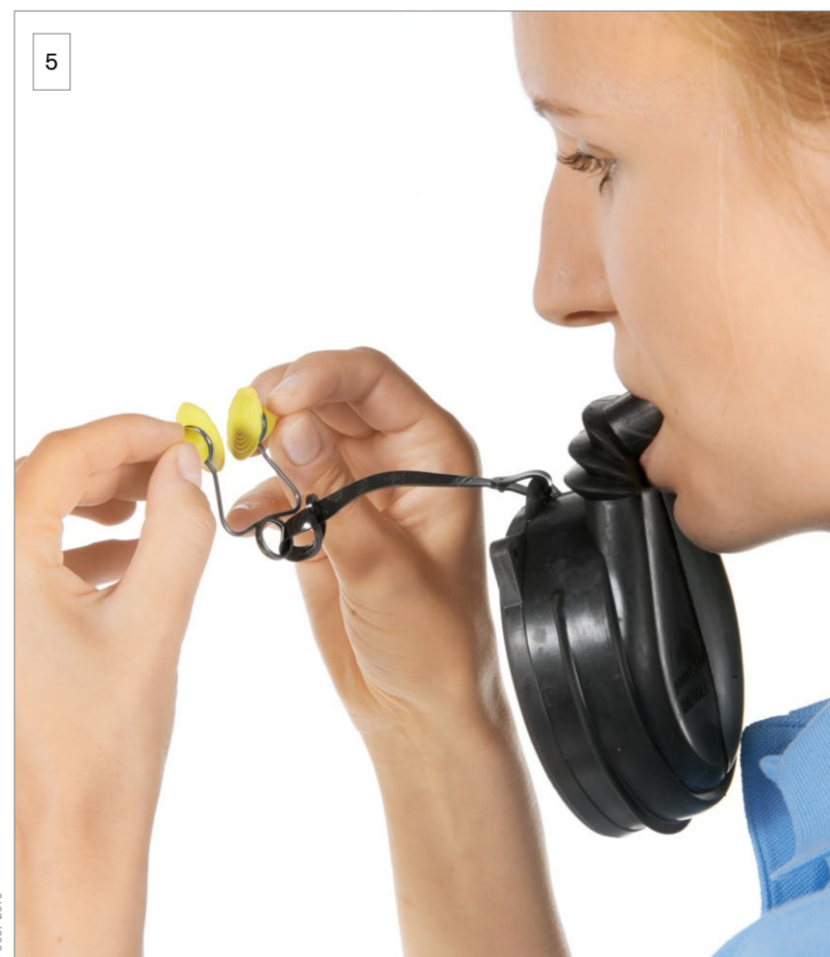
5 Nehmen Sie das Mundstück in den Mund und umschließen Sie es mit den Lippen. Halten Sie die Beißzapfen mit den Zähnen. Ziehen Sie die Nasenklammer auseinander.