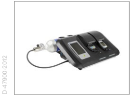
Dräger X-dock Vollautomatischer Funktionstest und Justierung