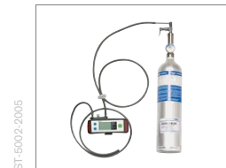
Basis-Test mit Gas