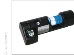
Dräger Bump Test Station Semi-automatischer Anzeigetest

Mit praxisingerechten Wartungsprodukten und Dienstleistungen machen wir Ihnen die Prüfung Ihrer Gaswarngeräte ganz einfach.