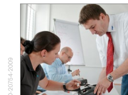
Schulungen, u.a. Qualifiziertes Fachpersonal